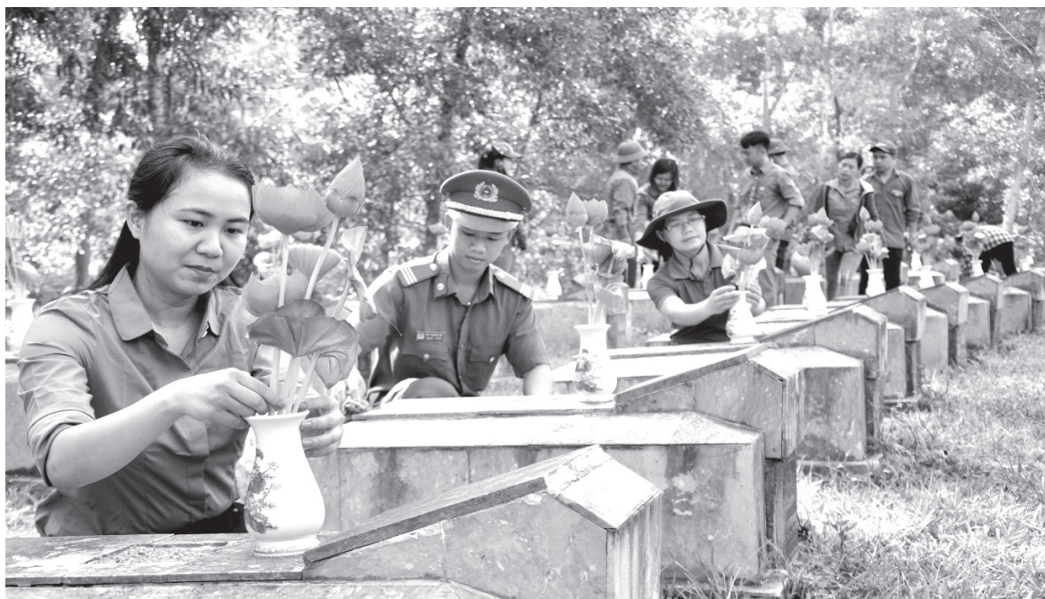
Công trình thanh niên: Hoa dâng mộ liệt sỹ

Giáo dục truyền thống cách mạng cho đoàn viên, thanh niên là một trong những nhiệm vụ hết sức quan trọng được Đoàn TNCS Hồ Chí Minh thực hiện xuyên suốt gắn với các chương trình và phong trào hành động thực tiễn của tổ chức; qua đó khơi dậy mạnh mẽ tinh thần đoàn kết, ý chí tự lực, tự cường, khát vọng vươn lên, phát huy giá trị bản sắc văn hóa con người Hà Tĩnh trong thế hệ trẻ tỉnh nhà, giúp đoàn viên, thanh niên nhận thức sâu sắc hơn về trách nhiệm của mình đối với quê hương, đất nước.