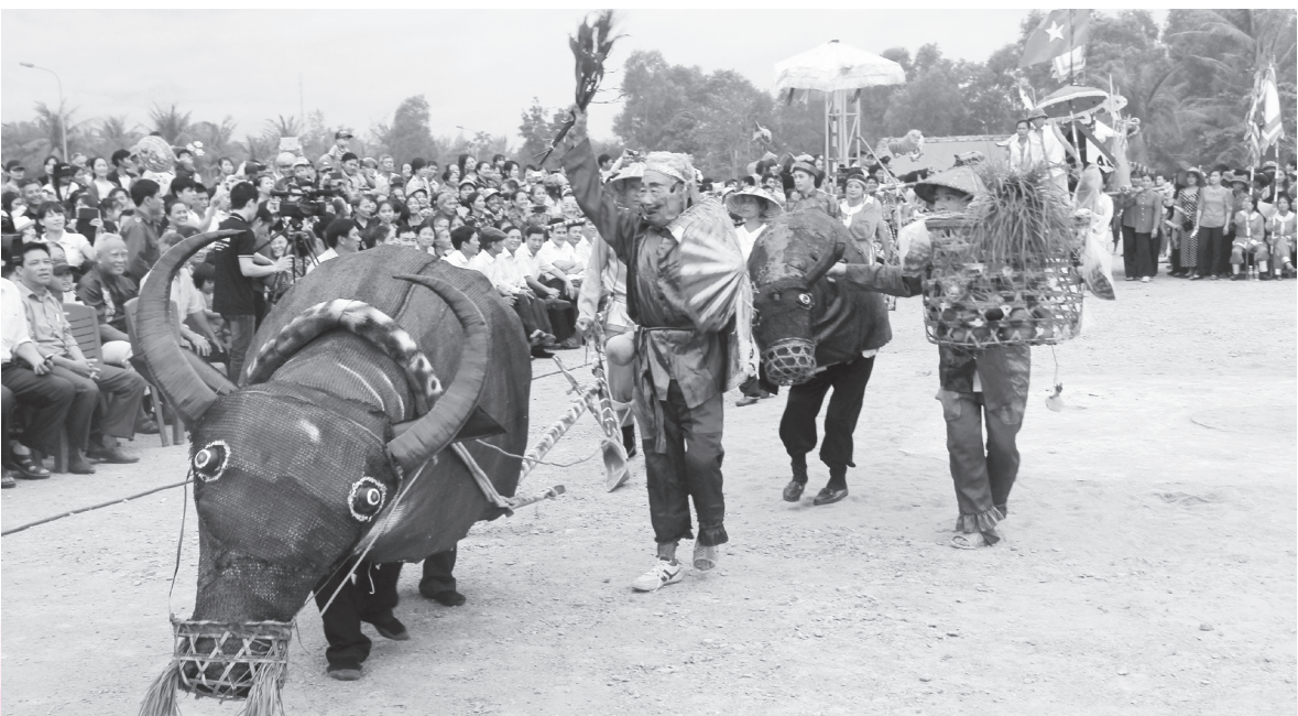
Dẫn hoa, diễu trò Sỹ - Nông Công Thương ở Xuân Thành

trình cụ thể. Tinh thần và quyết tâm ấy của huyện thực chất là sự vào cuộc của toàn Đảng bộ và nhân dân theo tinh thần Chỉ thị 27-CT/TW, năm 1998 của Bộ Chính trị, Quyết định 308-2005/QĐ-TTg của Thủ tướng Chính phủ “Về việc thực hiện nếp sống văn minh trong việc cưới, việc tang và lễ hội”.