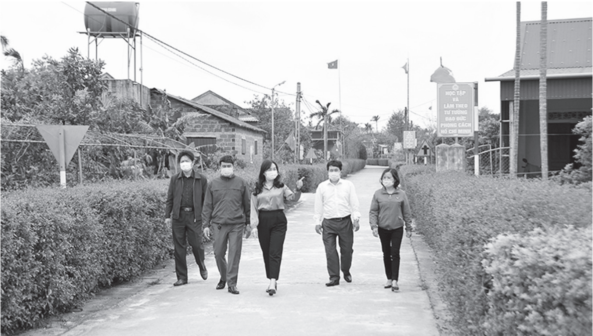
Lãnh đạo Hội nông dân tỉnh tham quan khu dân cư kiểu mẫu thôn Yên Mỹ, xã Yên Hòa, huyện Cẩm Xuyên

Xác định vai trò trung tâm, nòng cốt của Hội Nông dân đối với nhiệm vụ xây dựng nông thôn mới, nông thôn mới nâng cao, nông thôn mới kiểu mẫu, thời gian qua Hội Nông dân các cấp đã triển khai nhiều hoạt động nhằm phát huy vai trò của mình trong công cuộc xây dựng nông thôn mới nói chung cũng như xây dựng nông thôn mới nâng cao, kiểu mẫu, góp phần cùng hệ thống chính trị xây dựng nên những điểm sáng về nông nghiệp, nông thôn trong toàn tỉnh.