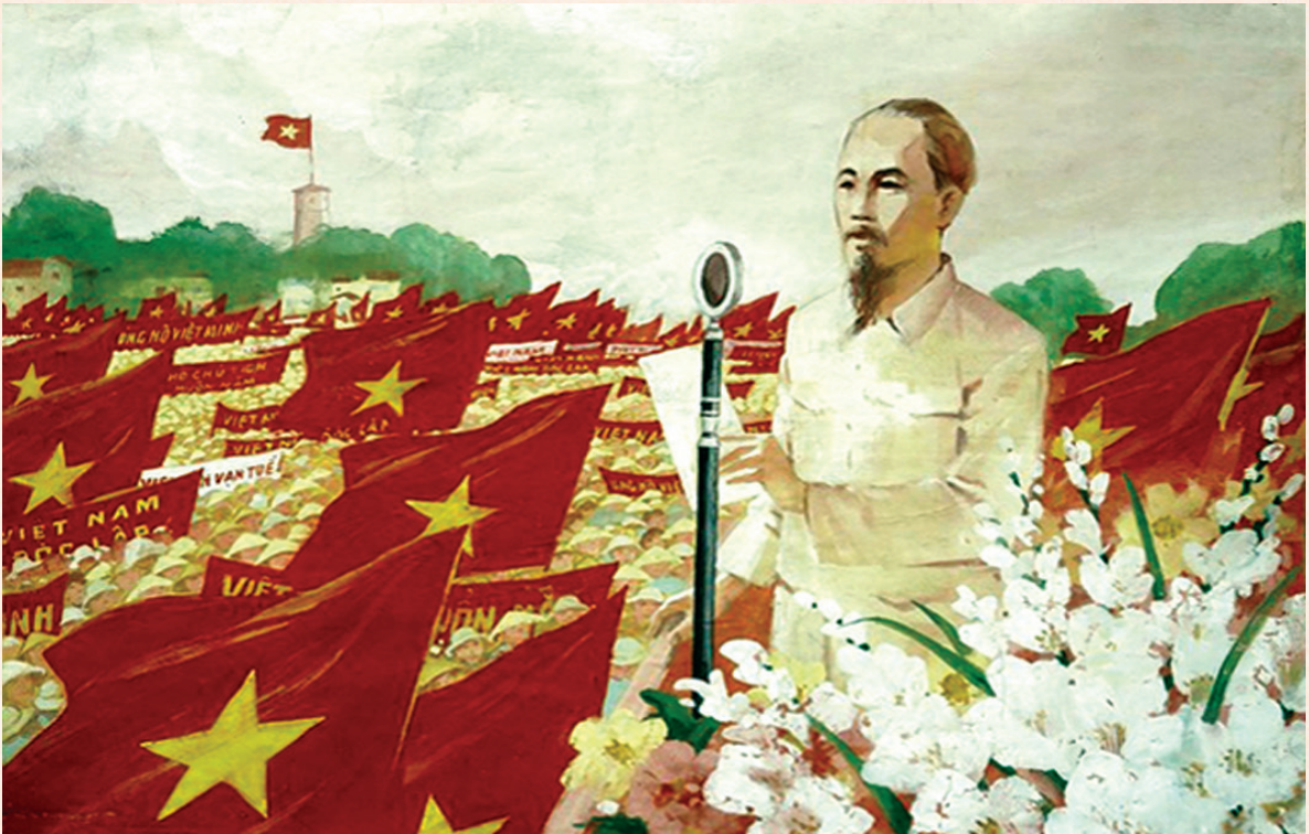
Bác Hồ đọc Tuyên ngôn Độc lập - Tranh: Nguyễn Dương

Thắng lợi của Cách mạng Tháng Tám và sự ra đời của nước Việt Nam Dân chủ Cộng hòa, nay là Cộng hòa xã hội chủ nghĩa Việt Nam là một trong những thắng lợi nổi bật nhất, vĩ đại nhất của Cách mạng Việt Nam trong thế kỷ XX. Thắng lợi đó gắn liền với sự lãnh đạo sáng suốt, tài tình của Đảng và Chủ tịch Hồ Chí Minh - lãnh tụ thiên tài của Đảng và dân tộc ta.