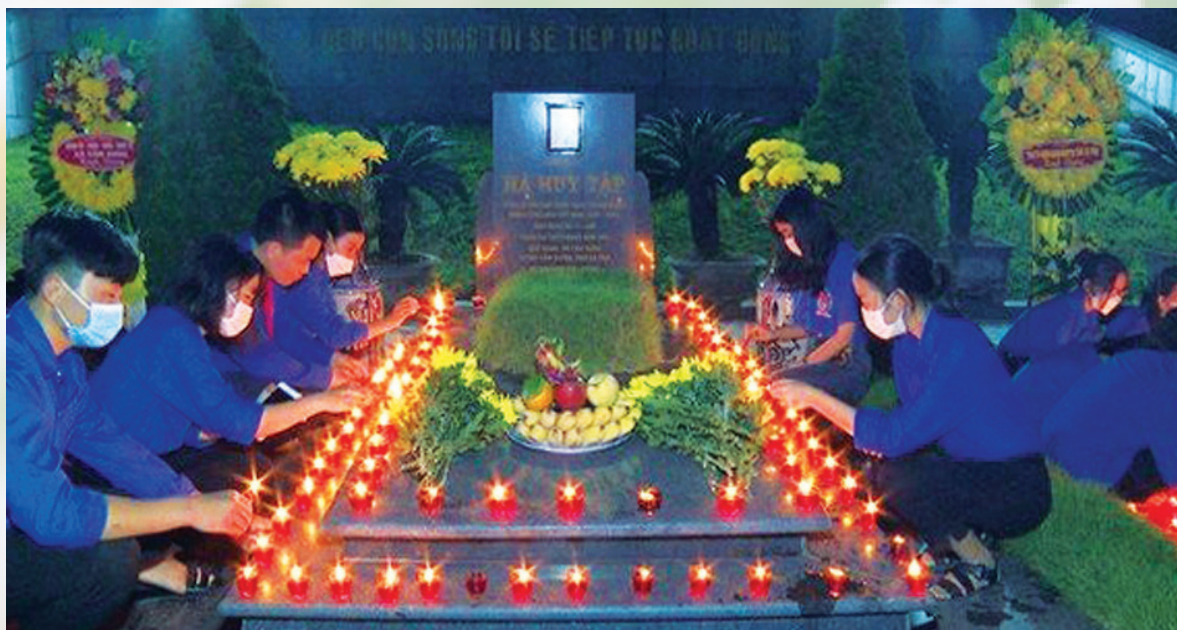
Tuổi trẻ Cẩm Xuyên thắp nến tri ân tại khu mộ đồng chí Hà Huy Tập

Dân tộc ta luôn sâu nặng nghĩa tình Nhớ ơn anh đã hy sinh vì nước Tuổi trẻ hôm nay vẫn đang tiếp bước Với niềm tự hào “Mãi mãi tuổi hai mươi”.