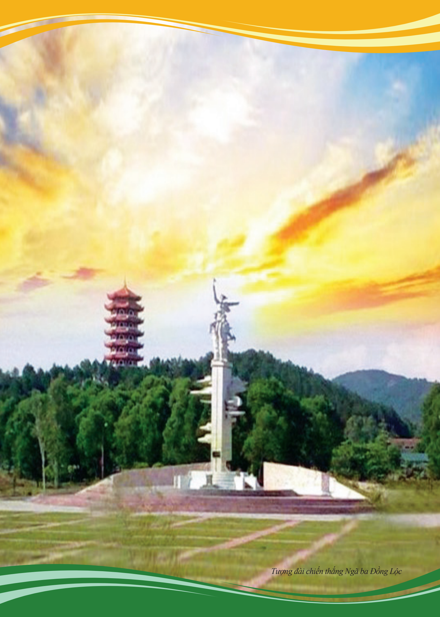
Trượng đài chiến thắng Ngã ba Đồng Lộc