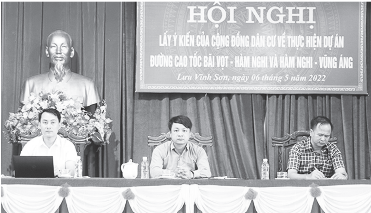
Hội nghị lấy ý kiến người dân về thực hiện dự án đường cao tốc tại xã Lưu Vĩnh Sơn