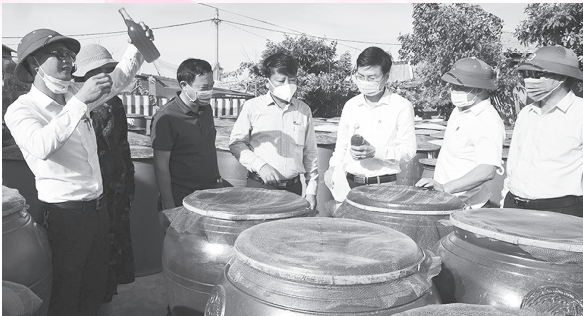
Lãnh đạo huyện Lộc Hà kiểm tra sản xuất kết hợp đồng viên Nhân dân thi đua lao động, xây dựng sản phẩm OCOP ở thị trấn Lộc Hà

“Dân vận khéo” trên lĩnh vực xây dựng Đảng và hệ thống chính trị đã góp phần xây dựng mối quan hệ mật thiết giữa Đảng với nhân dân, xây dựng tổ chức cơ sở Đảng ngày càng trong sạch, vững mạnh.