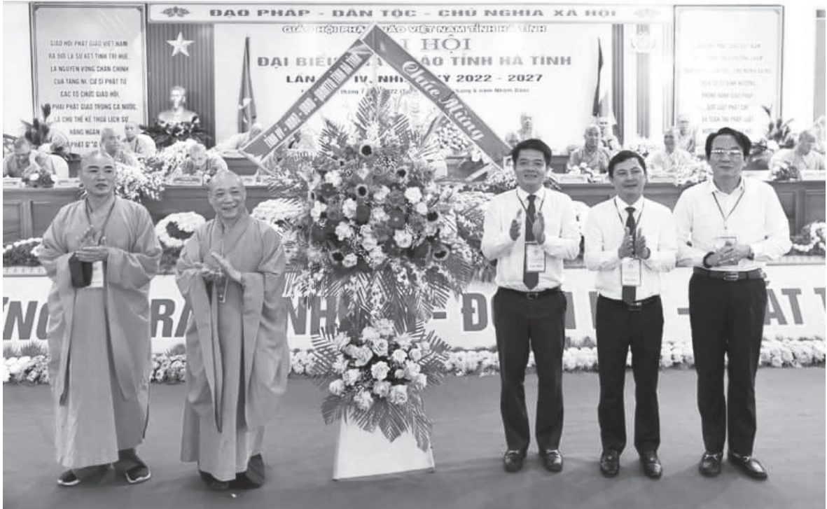
Lãnh đạo tỉnh tặng hoa chúc mừng Đại hội đại biểu Phật giáo tỉnh Hà Tĩnh lần thứ IV, nhiệm kỳ 2022 - 2027

cam; khám chữa bệnh cho người nghèo; nấu cháo từ thiện tại Bệnh viện Đa khoa Đức Thọ, hỗ trợ bệnh nhân chạy thận và bệnh nhân có hoàn cảnh khó khăn. Ban trị sự Phật giáo Thành phố và Phật tử kết hợp với Ủy ban mặt trận Tổ quốc thành phố tổ chức chương trình “Tết ấm tình người” tặng quà cho trại trẻ mồ côi SOS, tặng quà cho nạn nhân chất độc da cam, Hội người mù của tỉnh mỗi khi tết đến xuân về; Ban Trị sự Phật giáo huyện Kỳ Anh, huyện Can Lộc chú ý đến hoạt động làm nhà nhân ái, đã xây dựng 06 nhà tình thương cho người nghèo, tặng xe đạp cho học sinh nghèo vượt khó, ủng hộ quỹ khuyến học, ủng hộ tặng quà cho các xã xây dựng nông thôn mới...