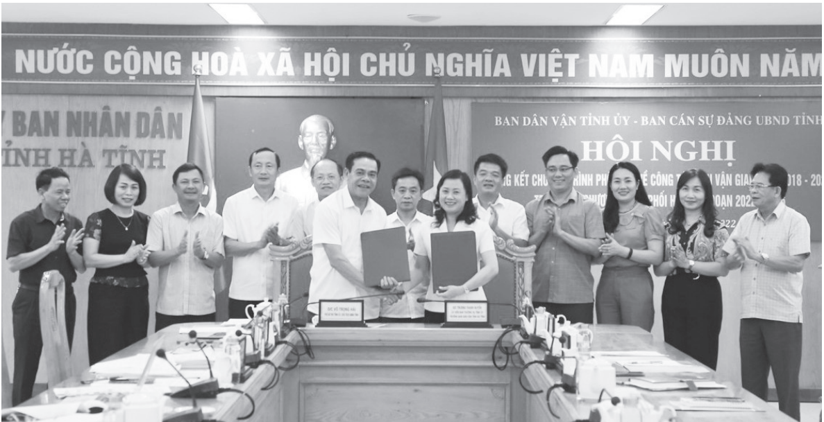
Lễ Ký kết chương trình phối hợp về công tác dân vận hợp giai đoạn 2022 - 2026 giữa Ban Dân vận Tỉnh ủy và Ban Cán sự Đảng Ủy ban Nhân dân tỉnh Hà Tĩnh