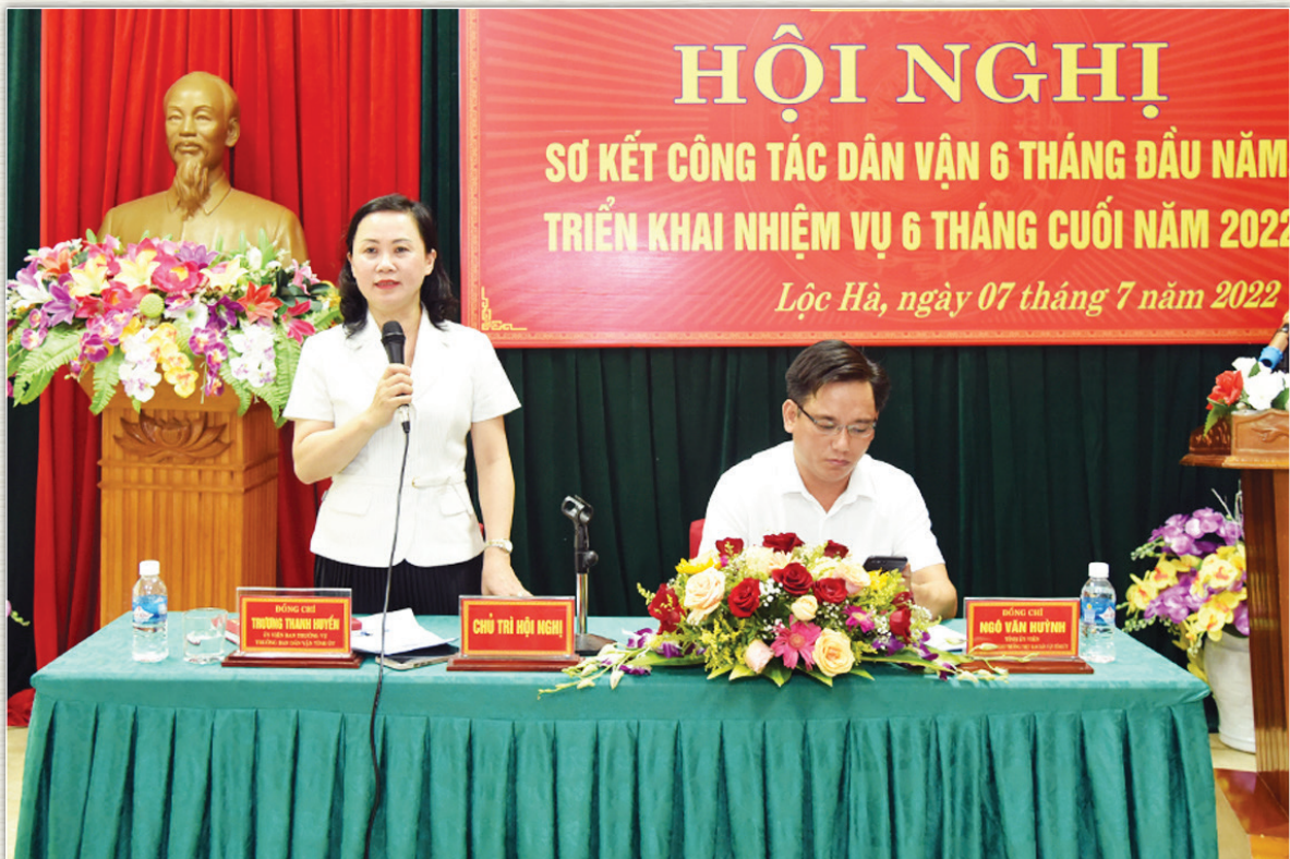
Hội nghị sơ kết công tác Dân Vận 6 tháng đầu năm 2022