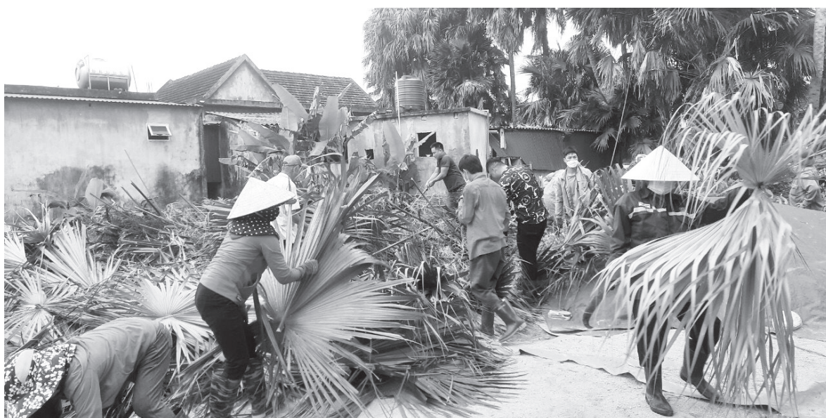
Nhân dân thôn Tân Thanh xóa bỏ vườn tạp xây dựng nông thôn mới

tiếp tục tập trung chỉ đạo các thôn phối hợp thực hiện đồng bộ các giải pháp cụ thể, chú trọng phát huy QCDC ở cơ sở nhằm duy trì, nâng cao chất lượng các tiêu chí. Với tinh thần nỗ lực vượt khó, quyết tâm thực hiện, đến cuối năm 2021, cấp ủy, chính quyền và nhân dân xã Thạch Xuân xây dựng thành công xã nông thôn mới nâng cao, trước thời hạn 2 năm so với kế hoạch. Mặc dầu không nằm trong nhóm xã được đầu tư xây dựng xã nông thôn mới nâng cao năm 2021 song