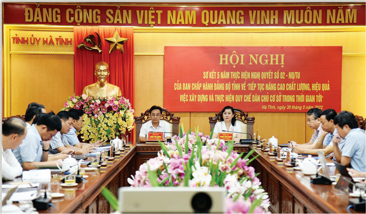
Hội nghị sơ kết 05 thực hiện Nghị quyết 02-NQ/TU của Ban Chấp hành Đảng bộ tỉnh Hà Tĩnh, nhiệm kỳ 2015-2020