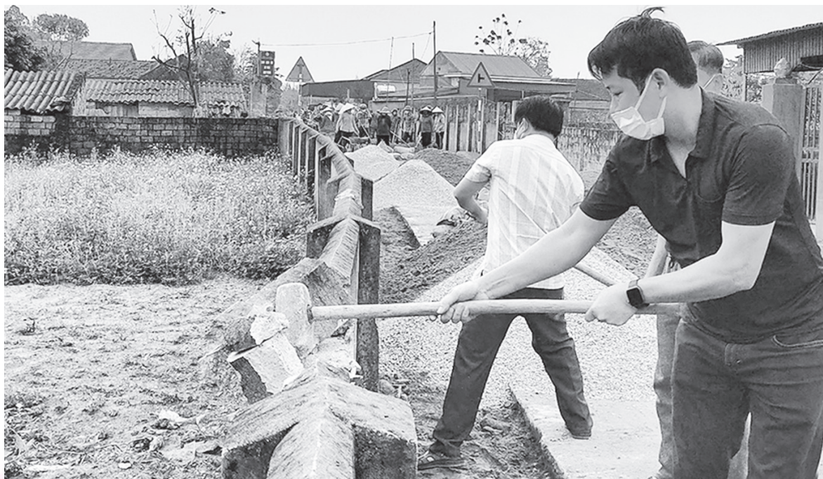
Cán bộ UBND huyện Lộc Hà tham gia công tác dân vận kết hợp lao động nông thôn mới ở thôn Hồng Thịnh (xã Thịnh Lộc).

nhằm thực hiện nghiêm túc các văn bản chỉ đạo, hướng dẫn của cấp trên và triển khai thực hiện bằng các chương trình, kế hoạch cụ thể, phù hợp với tình hình thực tiễn của địa phương, đơn vị. Làm tốt công tác tuyên truyền, lan tỏa các mô hình, điển hình dân vận khéo, cũng