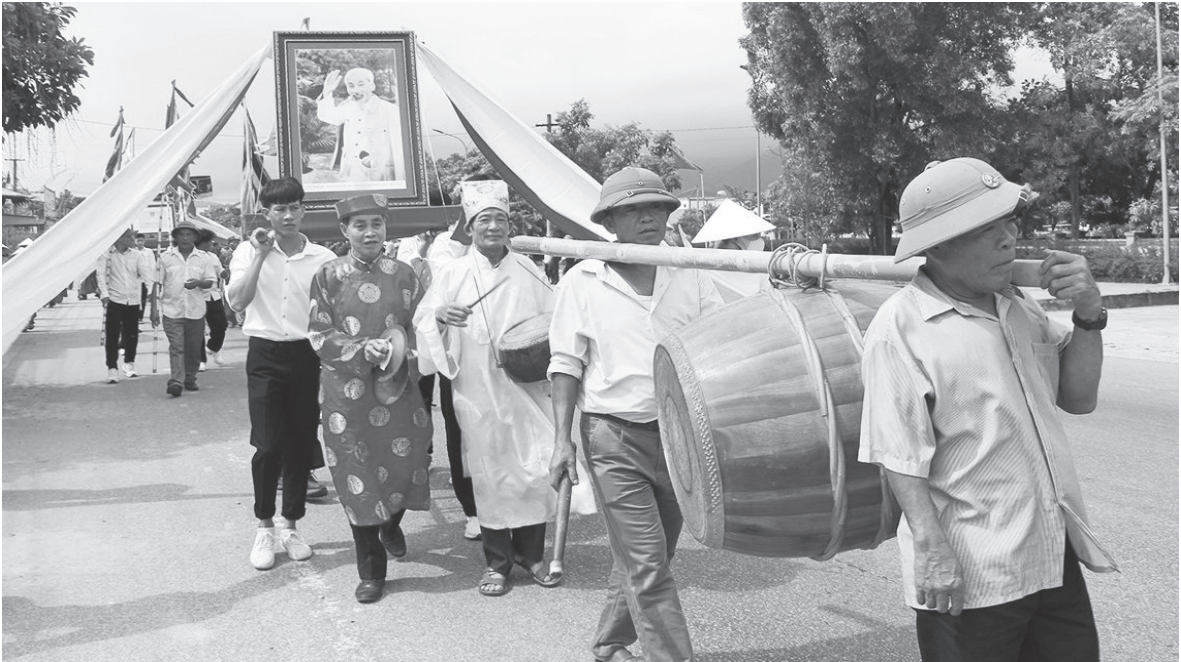
Lễ rước Bằng công nhận di tích lịch sử văn hóa cấp tỉnh Nhà thờ Hồ Văn xã Xuân Liên.

văn hóa đa sắc Giang đình Cổ độ, hát nói, ví dặm đồ đưa phường vải, hát mới ở Trung tâm văn hóa huyện... vừa là nhân cốt, vừa là chủ thể đưa phong trào lễ hội phải là điểm sáng, là mô hình của toàn tỉnh Hà Tĩnh.