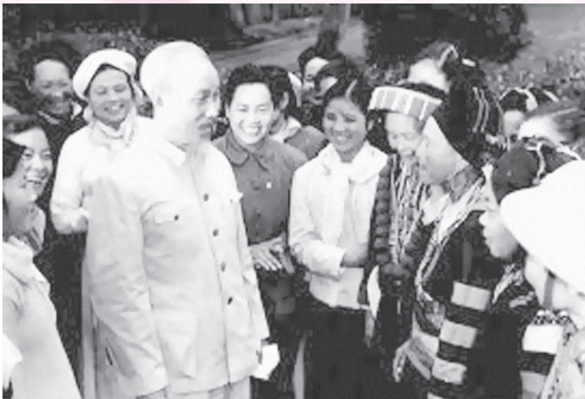
Ảnh tư liệu

dân đồng bào và thế giới về sự ra đời của nước Việt Nam Dân chủ Cộng hòa. Người nhấn mạnh: “Nước Việt Nam có quyền hưởng tự do và độc lập, và sự thật đã thành một nước tự do, độc lập. Toàn thể dân tộc Việt Nam quyết đem tất cả tinh thần và lực lượng, tính mạng và của cải để giữ vững quyền tự do, độc lập ấy!”