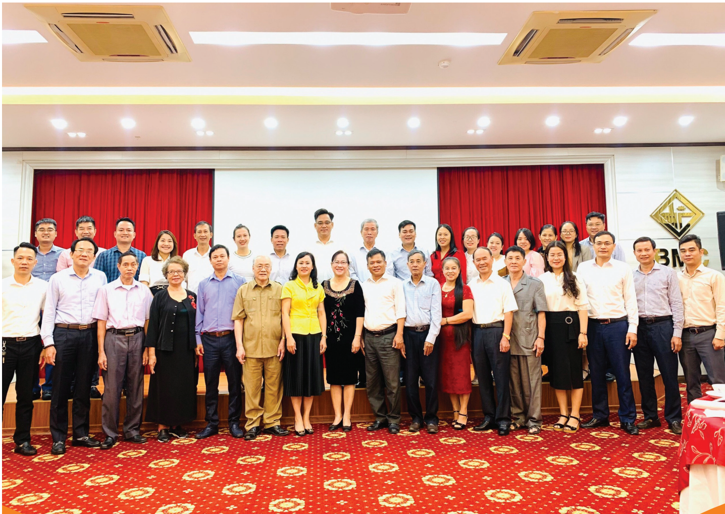
Gặp mặt lãnh đạo, cán bộ Ban Dân vận Tỉnh ủy Hà Tĩnh qua các thời kỳ nhân kỷ niệm 92 năm ngày truyền thống Công tác Dân vận của Đảng (15/10/1930 - 15/10/2023)