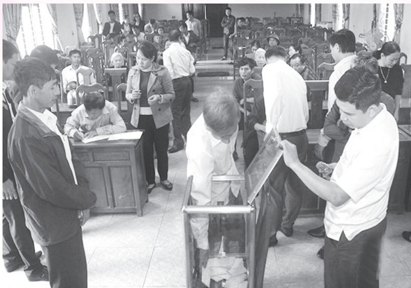
Người dân nhường đất cho dự án Cao tốc Bắc - Nam đoạn đi qua địa bàn các xã ở Đức Thọ được lần lượt bốc thăm các vị trí đất tại khu quy hoạch tái định cư.

Thứ tư , thường xuyên nắm bắt tâm tư, nguyện vọng, lắng nghe kiến nghị của người dân để đề xuất hướng giải quyết nhằm đảm bảo quyền lợi cho người dân. Tập trung giải quyết một số thiếu sót, bất cập trong quá trình triển khai công tác bồi thường, hỗ trợ, tái định cư. Tăng cường kỹ năng tuyên truyền của các thành viên trong Ban Chỉ đạo, các tổ công