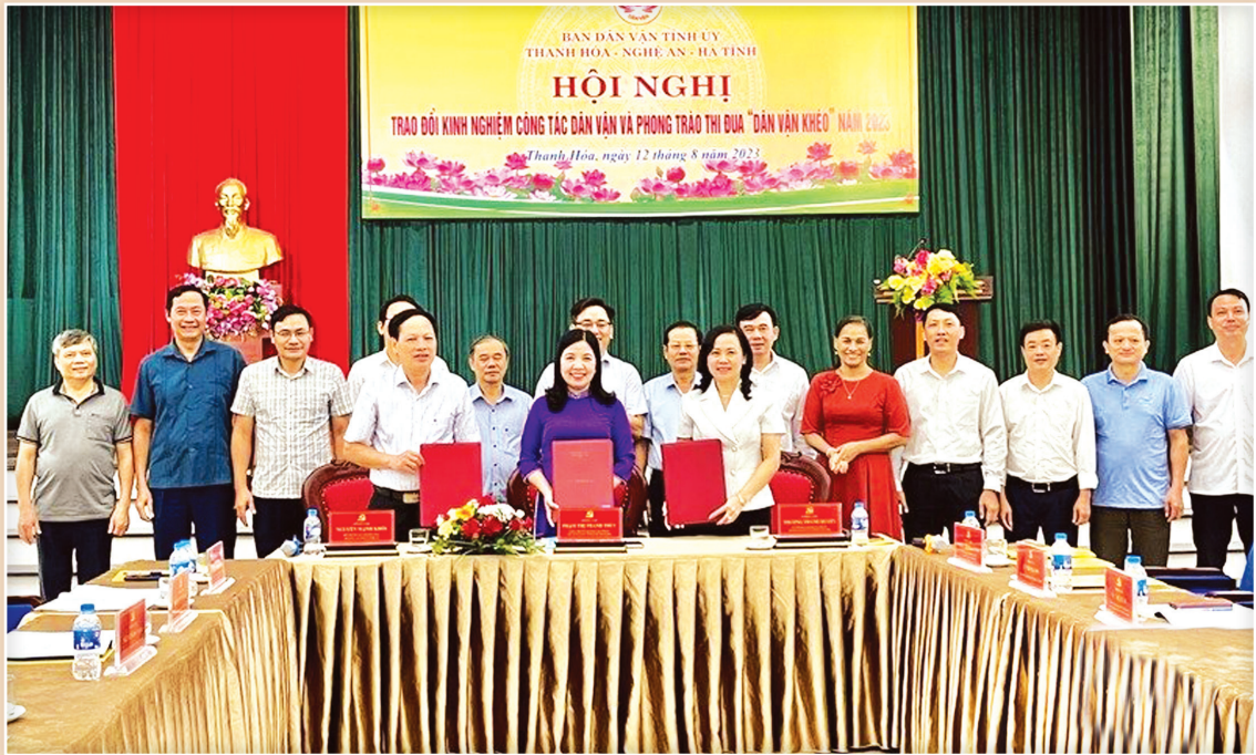
Các đồng chí lãnh đạo Ban Dân vận Tỉnh ủy 3 tỉnh: Thanh Hóa - Nghệ An - Hà Tĩnh ký Bản ghi nhớ phối hợp công tác dân vận giai đoạn 2023-2025