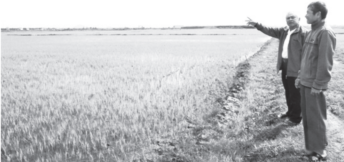
Sau khi di dời 2 ngôi mộ, cánh đồng thôn Liên Sơn, xã Kỳ Văn đã chuyển đổi thành công nhiều diện tích từ ô thửa nhỏ thành ô thửa lớn

Theo đó, UBND huyện đã chỉ đạo Phòng Tài chính - Kế hoạch, Phòng Nông nghiệp và Phát triển nông thôn huyện tham mưu bố trí kinh phí hỗ trợ việc di dời các ngôi mộ không có chủ tập trung về tại nghĩa trang các xã, Phòng Tài nguyên - Môi trường huyện hướng dẫn, giúp các xã quy hoạch, bố trí địa điểm để quy tập các ngôi mộ. Ủy ban MTTQ huyện chủ trì, phối hợp và lấy Hội Người cao tuổi các cấp làm nòng cốt cùng với các đoàn thể chính trị - xã hội huyện đẩy mạnh tuyên truyền, vận động các gia đình, dòng họ, tổ chức, cá nhân đồng thuận và tích cực, tự