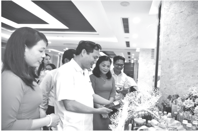
Trung bày các sản phẩm giới thiệu nông sản sạch, khởi nghiệp sáng tạo của phụ nữ

Với phương châm “Ở đâu có phụ nữ, ở đó có hoạt động Hội”, “Trung ương định hướng chiến lược, tỉnh vận dụng sáng tạo, huyện đồng hành cơ sở, xã nắm chắc hội viên, chi thấu hiểu phụ nữ”; các cấp Hội Phụ nữ Hà Tĩnh đã không ngừng đổi mới nội dung, phương thức hoạt động, lấy phụ nữ làm trung tâm, hướng về cơ sở triển khai nhiều hoạt động thiết thực, hiệu quả, rõ địa chỉ, có tính lan tỏa cao. Hội LHPN tỉnh đã ban hành 2 nghị quyết chuyên đề về tập hợp hội viên; chỉ đạo các cấp Hội nâng cao chất lượng các mô hình tập hợp hội viên, xây dựng Chi hội Phụ nữ kiểu mẫu; tiếp tục phát huy vai trò Hiệp