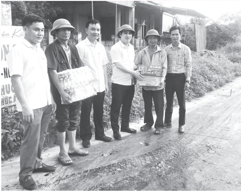
Đồng chí Bí thư Thị ủy Lê Thành Đông và các đồng chí trong đoàn chỉ đạo của Thị ủy tại xã Thuận Lộc, cấp ủy, chính quyền xã đến động viên nhân dân Thôn Tân Hòa chỉnh trang đô thị.

hoạt động đảm bảo tuân thủ theo quy chế, nguyên tắc làm việc; liên tục nhiều năm đạt và vượt các mục tiêu, chỉ tiêu phát triển kinh tế - xã hội, đảm bảo quốc phòng - an ninh. Ban hành và chỉ đạo thực hiện tốt các quy hoạch, kế hoạch, đề án, cơ chế chính sách; tích cực phối hợp với Mặt trận Tổ quốc và các đoàn thể chính trị - xã hội trong triển khai các nhiệm vụ chính trị, các phong trào thi đua yêu nước, tạo nên nhiều thành quả quan trọng.