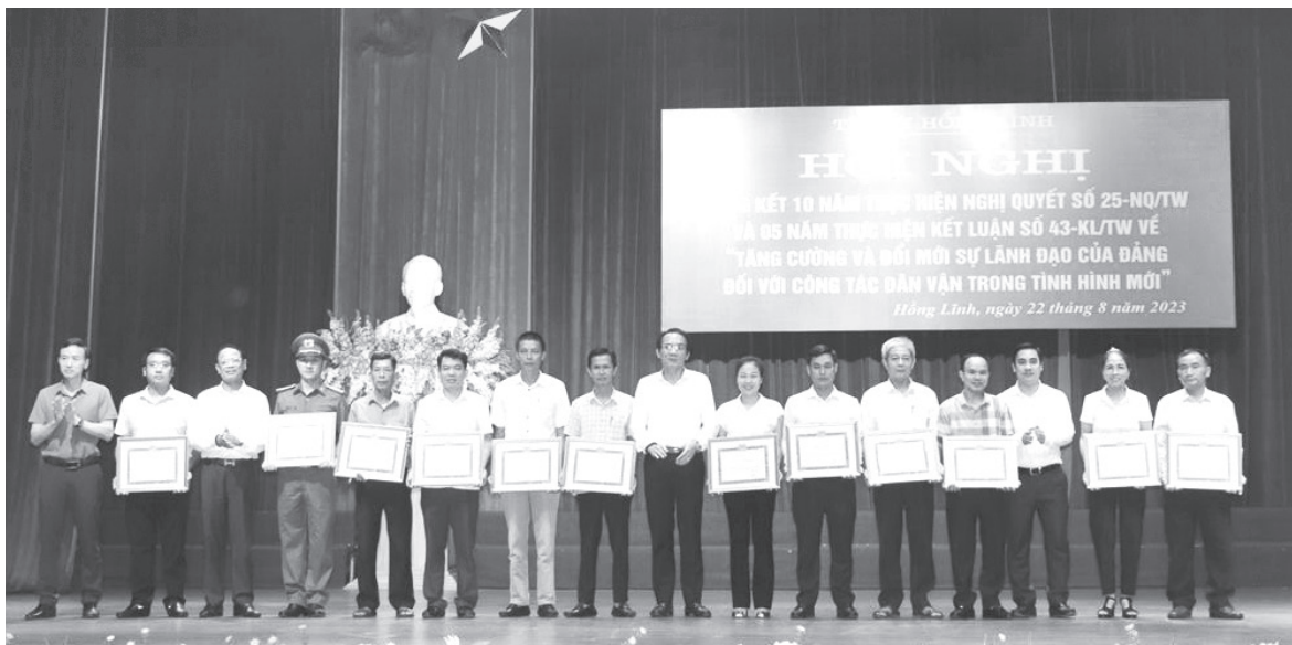
Lãnh đạo Ban Dân vận Tỉnh ủy và lãnh đạo Thị ủy trao giấy khen cho các tập thể thực hiện hiệu quả Nghị quyết số 25-NQ/TW.

Nghị quyết số 25-NQ/TW, ngày 03/6/2013 của Ban Chấp hành Trung ương khóa XI “về tăng cường và đổi mới sự lãnh đạo của Đảng đối với công tác dân vận trong tình hình mới” như một luồng sinh khí mới giữa thời điểm thị xã Hồng Lĩnh đang tập trung mọi lực lượng để phát triển kinh tế - xã hội, xây dựng và chỉnh trang đô thị, xã Thuận Lộc đạt các tiêu chí nông thôn mới, các phường đạt tiêu chí đô thị văn minh, thị xã đạt tiêu chí đô thị loại III.