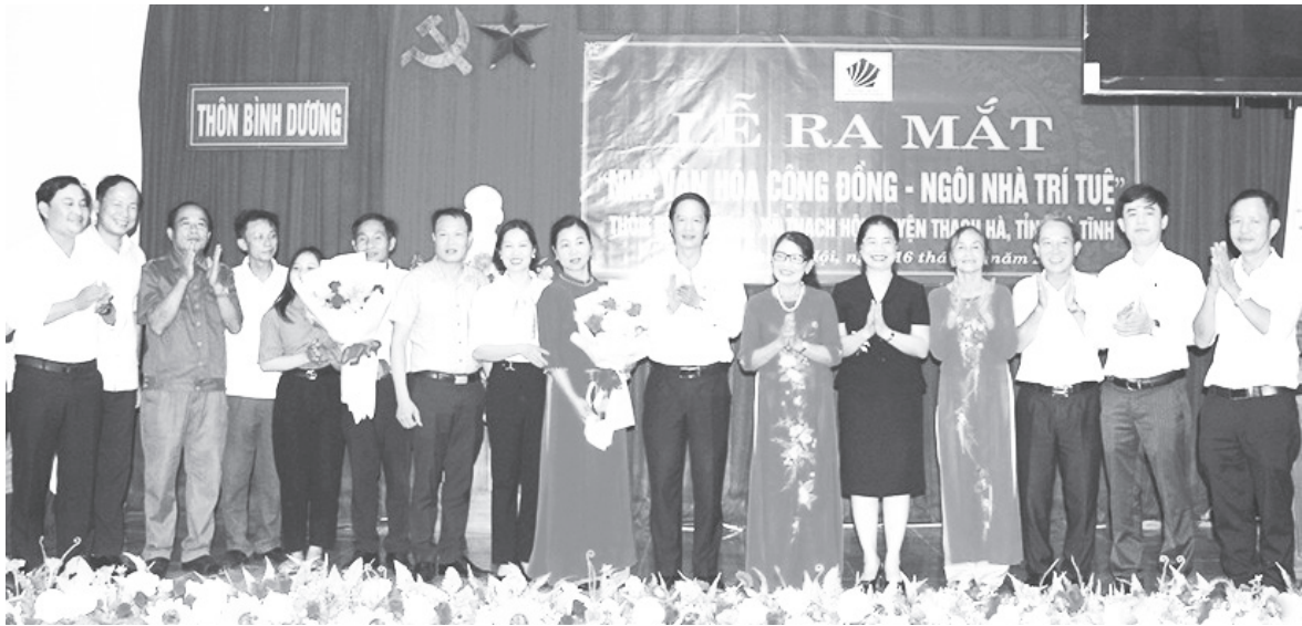
Ban Thường trực Ủy ban MTTQ xã Thạch Hội tổ chức lễ ra mắt “Nhà văn hóa cộng đồng - ngôi nhà trí tuệ” tại thôn Bình Dương (tháng 9/2023)

Thấm nhuần lời dạy của Chủ tịch Hồ Chí Minh: “Dân vận khéo thì việc gì cũng thành công”, thời gian qua, các cấp ủy đảng, chính quyền, MTTQ và các đoàn thể chính trị xã Thạch Hội đã cụ thể hóa phong trào thi đua “Dân vận khéo” bằng các mô hình, các hoạt động sôi nổi, rộng khắp, tạo sức lan tỏa sâu rộng trong Nhân dân. Qua đó, góp phần huy động nguồn lực chung sức xây dựng nông thôn mới, nông thôn mới nâng cao, nông thôn mới kiểu mẫu, tạo những bước chuyển mình tích cực ở các khu dân cư tại các thôn, xóm trên địa bàn, nhất là trong xây dựng khu dân cư nông thôn mới thông minh tại thôn Bình Dương.