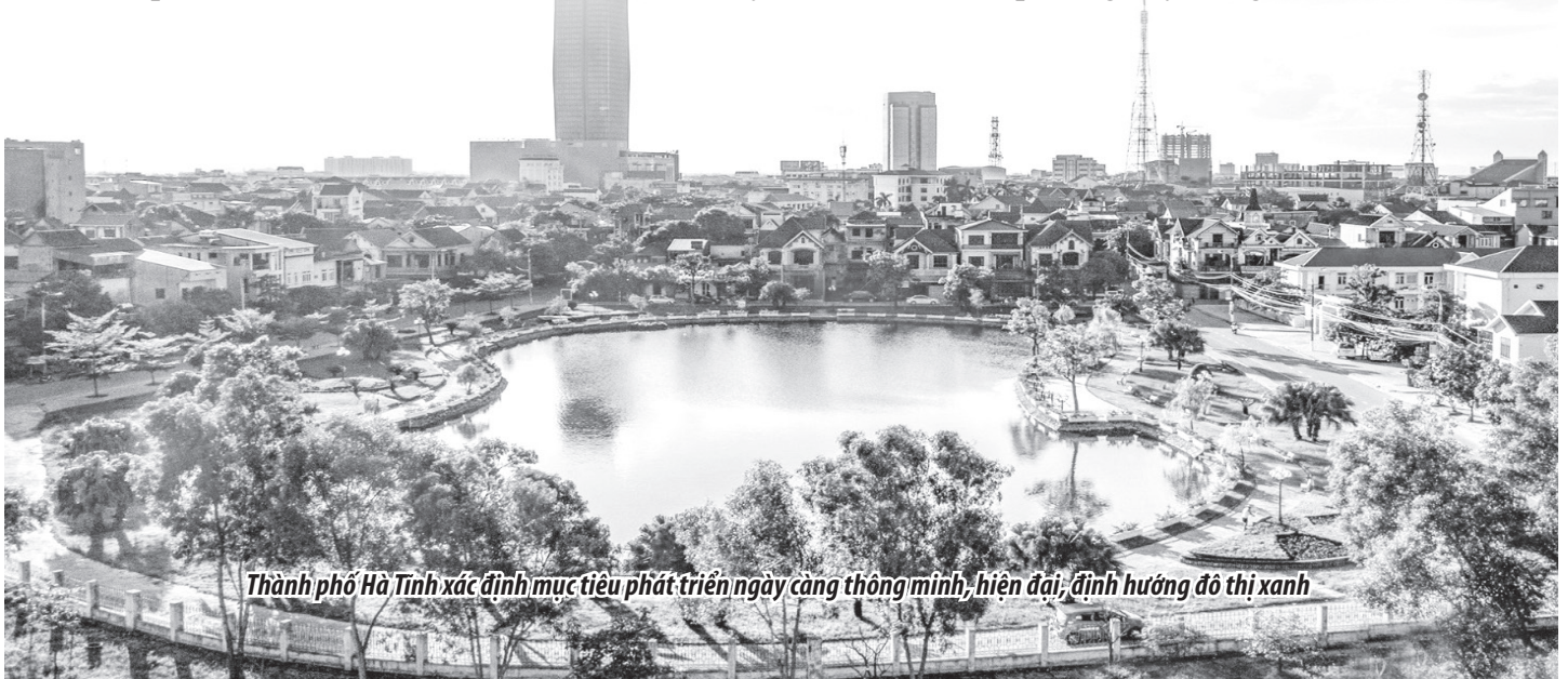
Thành phố Hà Tĩnh xác định mục tiêu phát triển ngày càng thông minh, hiện đại, định hướng đô thị xanh

Ban Thường vụ Thành ủy đã ban hành Nghị quyết chuyên đề số 04-NQ/ThU, ngày 12/10/2017 về “Tăng cường sự lãnh đạo của Đảng trong việc nâng cao chất lượng nếp sống văn hóa, văn minh đô thị trên địa bàn thành phố Hà Tĩnh đến năm 2020 và những năm tiếp theo”; Chỉ thị số 35-CT/Th.U, ngày 24/5/2022 “Về đẩy mạnh thực hiện nếp sống văn minh trong việc cưới, việc tang trên địa bàn thành phố Hà Tĩnh”; Ủy ban nhân dân Thành phố đã ban hành Đề án nâng cao chất lượng nếp sống văn hóa văn minh đô thị; tập trung xây dựng các chuẩn