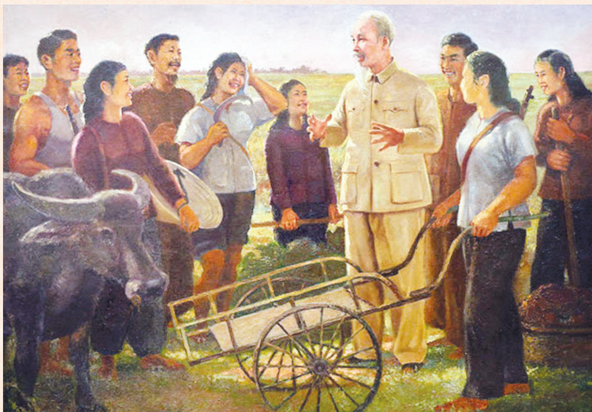
Bác Hồ với nhân dân

Sinh thời, Chủ tịch Hồ Chí Minh luôn khẳng định công tác vận động quần chúng là một nhiệm vụ chiến lược, có ý nghĩa quyết định đối với thành bại của cách mạng. Tư tưởng đó được Người thể hiện sinh động trong tác phẩm “Dân vận” đăng trên Báo Sự thật, số 120, ngày 15-10-1949, với bút danh X.Y.Z. Hơn 70 năm trôi qua, tác phẩm “Dân vận” của Người vẫn còn nguyên giá trị lý luận và thực tiễn sâu sắc; có ý nghĩa đặc biệt quan trọng trong công tác dân vận của Đảng hiện nay.