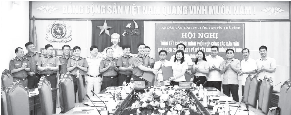
Lãnh đạo Ban Dân vận Tỉnh ủy và Công an tỉnh ký kết chương trình phối hợp công tác Dân vận giai đoạn 2022 - 2025.

Trong những năm qua, với sự quan tâm lãnh đạo, chỉ đạo của Ban Chấp hành Đảng bộ tỉnh, Ban Thường vụ Tỉnh ủy và cấp ủy các cấp, phát huy vai trò của cả hệ thống chính trị, công tác dân vận trên địa bàn tỉnh không ngừng đổi mới và nâng cao chất lượng, hiệu quả hoạt động, đạt được nhiều kết quả thiết thực góp phần quan trọng vào những thành tựu chung của tỉnh nhà, nhân lên niềm tin giữa Đảng, chính quyền và Nhân dân.