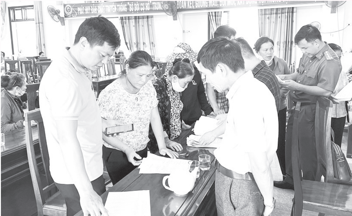
Thành viên Hội đồng GPMB huyện Đức Thọ hướng dẫn người dân kiểm tra các thông tin trên bản áp giá đền bù và giải thích các thắc mắc của người dân