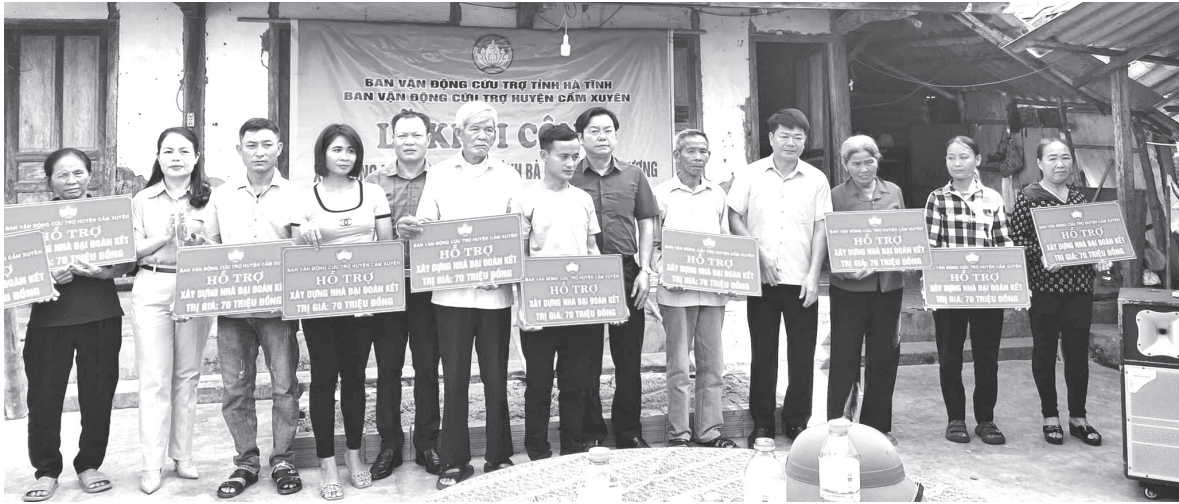
Ban Văn động cứu trợ, Ủy ban MTTQ huyện Cẩm Xuyên tặng biểu trưng hỗ trợ làm nhà Đại đoàn kết cho các hộ nghèo, cận nghèo trên địa bàn huyện

UVBTV, Trưởng ban Dân vận Huyện ủy Chủ tịch MTTQ huyện Cẩm Xuyên