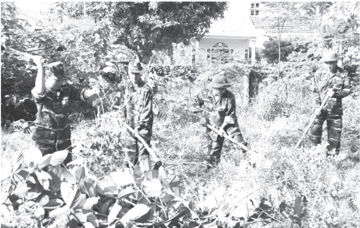
Ban Chỉ huy Quân sự huyện Nghi Xuân (Hà Tĩnh) giúp thôn Lam Thủy (xã Xuân Giang) xây dựng khu dân cư kiểu mẫu.

vũ trang tăng cường phối hợp trong việc tham mưu cấp ủy, chính quyền các cấp cụ thể hóa, triển khai thực hiện kịp thời, hiệu quả các nghị quyết, chỉ thị, quyết định, kết luận của Đảng, chính sách, pháp luật của Nhà nước, của Bộ Quốc phòng, Bộ Công an liên quan đến công tác dân vận và nhiệm vụ quân sự, quốc phòng, đảm bảo an ninh trật tự, an toàn xã hội ở địa phương; đặc biệt phối hợp tham mưu Ban Thường vụ Tỉnh ủy ban hành Quyết định số 269-QĐ/TU, ngày 30/11/2021 về Quy chế công tác dân vận của hệ thống chính trị. Đặc biệt chú trọng